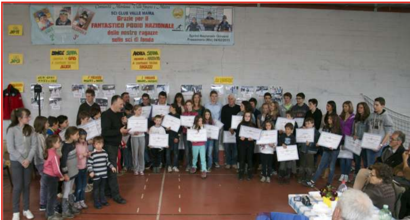
A pag. 3